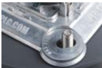
Anneaux de montage en place

-4 anneaux de montage et 4 rondelles en acier inoxydable (boulons et écrous de montage non inclus)