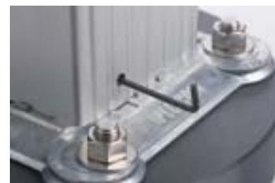
Clé hexagonale de 3.97 mm utilisée pour verrouiller / déverrouiller le socle

Vue de profil du socle double en position de service